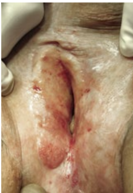
Über Jahre unbehandelter LS mit Krebsvorstufe an der rechten Labie.

sachen sind unbekannt, Schübe können aber v. a. durch Traumata im Genitalbereich ausgelöst werden. Auch Ernährung kann einen negativen Einfluss nehmen; berichtet wird von scharfem Essen oder auch säurehaltigen Getränken oder Zitrusfrüchten, die Unterschiede sind hierbei jedoch individuell erheblich. LS kann erblich sein, in etwa 50% der Fälle findet man weitere Familienangehörige, die betroffen sind (eigene, nicht publizierte Daten).