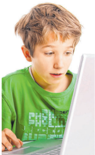
Computer und Smartphones üben auf Kinder einen besonderen Reiz aus.

fig Spielchen auf Computerscreens verfolgten, leidet nicht nur das Auge. „Beim Tablet ist alles platt“, erläuterte sie. Damit könne auch die Entwicklung des räumlichen Seh- und Vorstellungsvermögens bei Kindern leiden - der Wechsel zwischen Nah- und Fernsicht zum Beispiel. Das befördere verschwommenes Sehen und auch Schielen. „Im Grunde ist das wie bei Süßigkeiten“, ergänzte die Ärztin. „Computer sind verlockend für Kinder, aber man muss es begrenzen. Je jünger, desto weniger Nutzung.“ Ob Smartphone, Tablet oder PC, die Größe des Bildschirms spiele dabei keine Rolle. Kleine Kinder sollten lieber mit Bauklötzen spielen und die reale Welt drinnen und draußen erobern. Das sei besser.