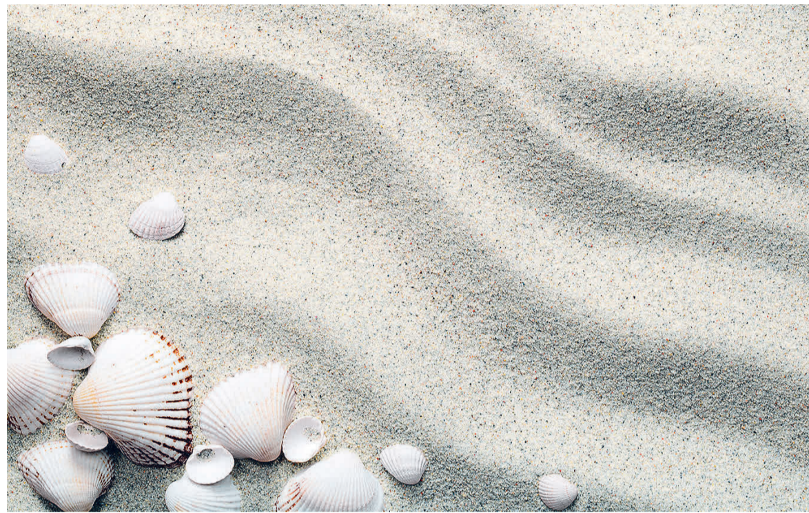
Die Muschel als Symbol: Der Verein will für Betroffene eine Boje und ein Anker im Meer der Verzweiflung sein.

Die Auslöser, die einen Lichen Sclerosus begünstigen, sind noch immer weitgehend unbekannt. Neben einer genetischen Disposition werden auch Infektionen und hormonelle Faktoren als mögliche Ursachen diskutiert. Unabhängig davon bedeutet die in Schüben verlaufende Erkrankung eine enorme Belastung für Betroffene. „Eine solche Diagnose ist nicht nur mit körperlichen Beschwerden verbunden, sondern tangiert auch die Partner-