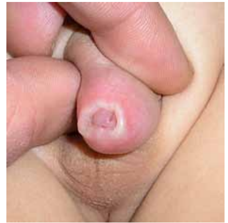
Foto: tipica fimosi a cicatrizzazione biancastra in un bambino con Lichen Sclerosus

Dato che si tratta probabilmente di una malattia autoimmune, l'obiettivo terapeutico consiste nel frenare localmente il sistema immunitario. A tale scopo sono indicati potenti corticoidi, come il clobetasol propinato o il mometasone fuorat sotto forma di pomate. Preparati al cortisone blandi (per es idrocortisone) non danno benefici nel trattamento della malattia. Nel caso non vengano tollerati i potenti corticoidi o qualora si rivelano inefficaci, si può, come seconda