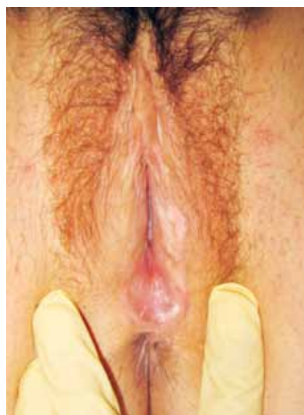
Foto: LS in una giovane donna, mancanza delle piccole labbra, l'introito è cicatrizzato posteriormente, il labbro grande sinistro è discretamente infettato dal Lichen.

Se non riconosciuto, il LS porta all'incollamento, fusione del prepuzio clitorideo e delle piccole labbra, in definitiva, a distruzioni irreversibili della vulva e restringimento dell'introito vaginale. Spesso i sintomi spariscono durante la pubertà, per una parte delle ragazze colpite, i disturbi si manifesteranno di nuovo anni dopo. Un LS non trattato, porta non di rado nell'età adulta a problemi nella coppia