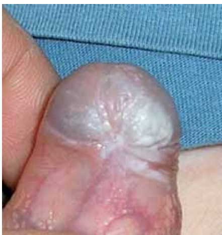
Foto: con prepuzio ancora riponibile si può riconoscere chiaramente nella zona perifrenulare la presenza di un frenulum breve.

La diagnosi di un LS nei maschietti, come pure nelle ragazzine, avviene spesso tardivamente e solo dopo l'invio presso uno specialista o un consulto specializzato.