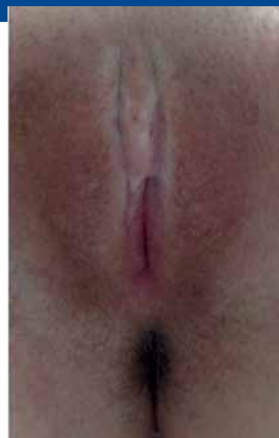
Foto: LS in stadio avanzato con incollamenti importanti e infezioni da Lichen

(sessualità limitata e dolorosa) e ad un aumentato rischio di sviluppare un cancro (ca. 4-6%). Una corretta terapia a lunga durata, accompagnata da una buona cura, può fermare il processo della malattia nella maggior parte dei casi e ridurre il rischio di cancro ai valori normali (Lee et al. 20015). Mancano a riguardo dati e risultati per ragazze affette da LS. Regolari controlli trimestrali a lunga durata sono consigliati. Nei maschietti è probabile una guarigione della malattia in seguito alla circoncisione completa. Post operativamente può svilupparsi una sclerotizzazione del meato urinario; dopo una circoncisione parziale o nei pazienti adiposi possono svilupparsi delle recidive. Nel caso di sospettata stenosi del meato è suggerito un chiarimento e approfondimento tramite uroflussimetria. Consigliati anche dei regolari controlli su lunga durata e, se necessario, un trattamento topico supplementare prescritto da un esperto. Si necessitano ulteriori ricerche per chiarire la patogenesi (Becker 2011)